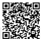
ZX70-EX 3D demo